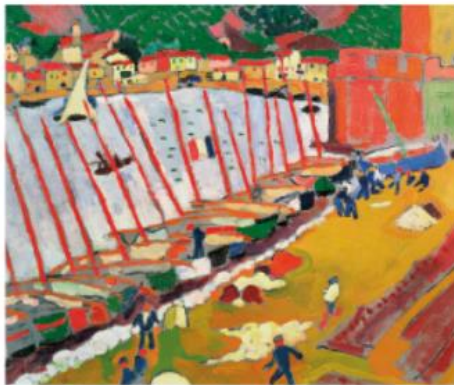
André Derain [czyt.: andre deré]. Port rybacki w Collioure [czyt.: koljur] Artysta zastosował w dziele kompozycję rytmiczną. Powtarzającymi się elementami są maszty i kadłuby żaglówek przycumowanych wzdłuż nabrzeża. W ten sposób powstaje wyraźny rytm, który wywołuje wrażenie ruchu. olej na płótnie 59,5 × 73,2 cm Muzeum Sztuki Współczesnej w Paryżu XX w.

Wystarczy raz wymyślić wzór, by potem powielić go dowolną ilość razy. Z tego powodu bardzo często rytm pojawia się w wytworach ręcznych takich, jak koronki, hafty, wycinanki ludowe, zdobienia naczyń, różne plecionki (np. koszyki).