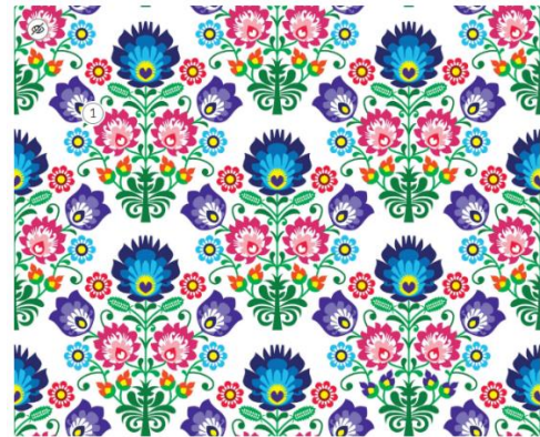
Ilustracja wektorowa. Wzory łowickie, online-skills, CC BY 3.0